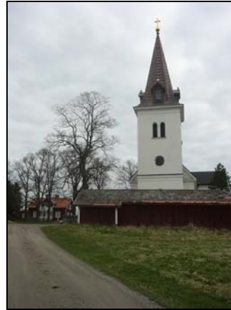
Östra Hargs kyrka omkring 1940 och 2007.