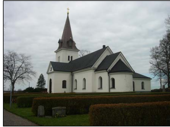
Östra Hargs kyrka 1921 och 2007.